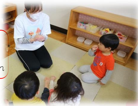
ビー玉などを両手を合わせた中に入れて、手を振りながらうたう。

おてぶし てぶし てぶしのなかに へびのなまやけ かえるのさしみ いっちょばこ やるから まるめておくれ