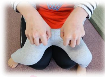
丸めた手を上下に動かす。