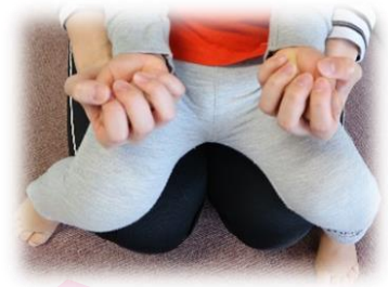
丸めた手を「ご」でひっくり返す。