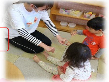
手の中のものをすばやく片方の手に握り「どっちだ？」とあてっこをして遊ぶ。

例年、園に集まって地域活動をしています。今年度は新型コロナウイルス感染拡大防止のため、集まって交流をすることはいたしません。子育てに関する事で何か相談したいこと等がございましたらご連絡ください。